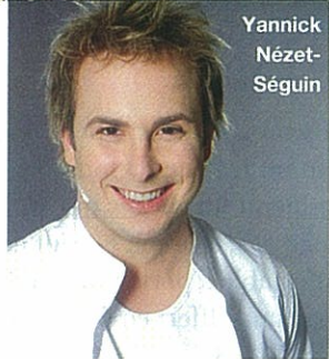
Yannick Nézet- Séguin